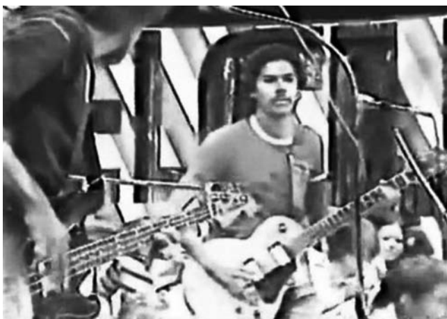
Un viejo video del grupo Enigma está colgado en You Tube

Yo toqué en varios grupos de salsa y organizamos el Mo-