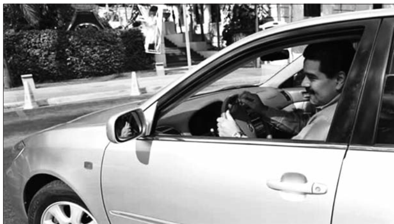
Para el Topo descubrir que el propio Presidente era el conductor del automóvil constituyó una gran sorpresa

El vehículo penetra raudo en el aeropuerto por una puerta lateral. Nicolás Maduro lo detiene junto a la escalera de acceso al avión presidencial. Descendemos. De repente advertimos que el presidente ha desaparecido, ya no está con nosotros. Lo vemos a unos cien metros: se ha acercado a la gente que estaba allí aguardando para saludarlo. ¿Cómo diablos ha llegado hasta ellos tan rápido? Regresa, sube al avión. Se introduce en la parte de atrás y lo perdemos de vista. Veinticinco minutos después aterrizamos en Maiquetía, el aeropuerto de Caracas. Un automóvil espera al presidente, que nos invita a acompañarlo. De nuevo conduce él mismo el