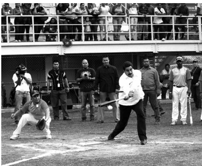
A Nicolás Maduro siempre se le dio bien el béisbol